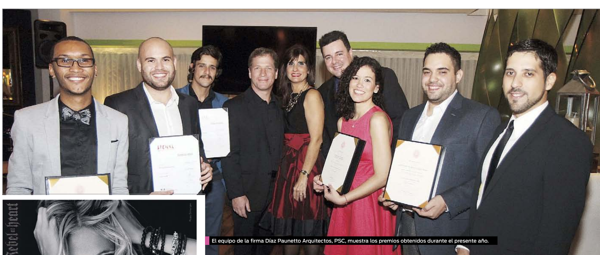
El equipo de la firma Díaz Paunetto Arquitectos, PSC, muestra los premios obtenidos durante el presente año.