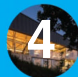
4. Casa El Boldo

Son interesantes las propuestas de relación con el entorno, el techo-jardín y la eficiencia energética acompañadas de un tratamiento volumétrico formal y constructivo claro y contrastante que por la relación abierto (abajo) y cerrado (arriba) da la sensación que lo pesado es sostenido por lo liviano y que lo cerrado que aporta a la seguridad se abre enriqueciendo el espacio interior de planta libre.