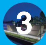
3. Casa Box

Destaca por el aprovechamiento de la topografía para enterrar ambientes, separarlos levemente del suelo o elevarlos ganando visuales; la relación con el exterior mediante la superposición perpendicular de dos volúmenes que abrazan los espacios abiertos generando la galería de ingreso, y el claro y simple contraste entre planos cerrados y transparentes, estructura metálica y hormigón texturado.