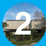
2. Casa P

Sobresale por la simplicidad y horizontalidad del volumen que se corresponde con la sencillez interior, privacidad, y relación con el entorno. El contraste entre abierto y cerrado, leve y pesado, se nutre del reflejo en el agua, de transparencias, del sutil tratamiento de líneas y superficies que cuelgan, de la profundidad y oscuridad de planos y materiales, sugiriendo que el volumen flotara.